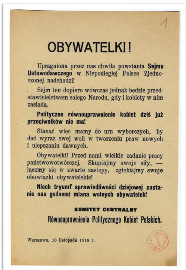
Ulotka programowa Równouprawnienia Politycznego Kobiet Polskich 1918